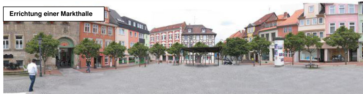
Errichtung einer Markthalle

Die vorgeschlagene Variante der Errichtung einer Markthalle auf dem Markt ist sowohl aus gestalterischen Aspekten als auch aus Gründen der einschränkenden Auswirkungen auf die bestehenden Nutzungsmöglichkeiten des Platzes nicht zu befürworten.