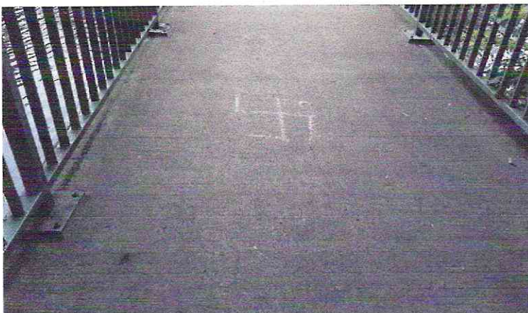
Dieses Hakenkreuz auf der Brücke am Sternberger Teich ist bereits entfernt worden.